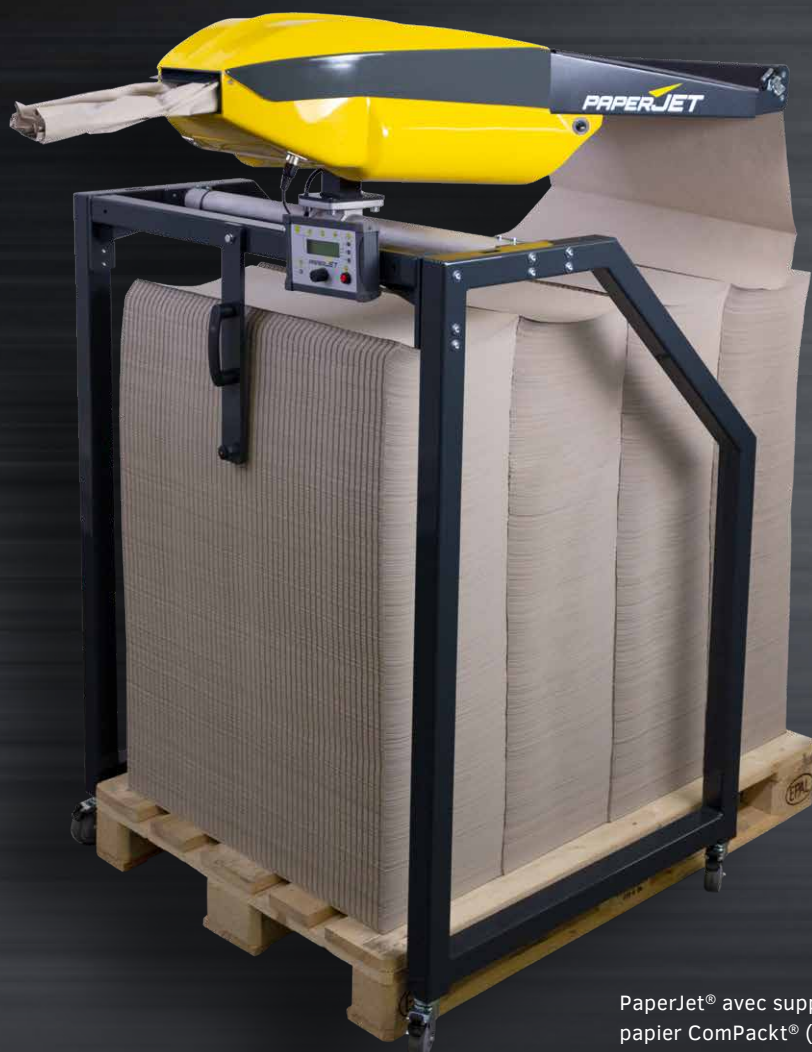
PaperJet® avec support EUPAL et papier ComPackt® (en continu)

contact@sem-emballage.fr www.sem-emballage.fr