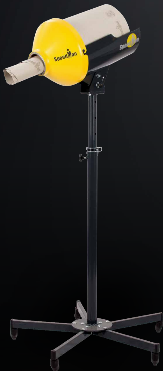
SpeedMan® Classic avec support à roulettes

contact@sem-emballage.fr www.sem-emballage.fr