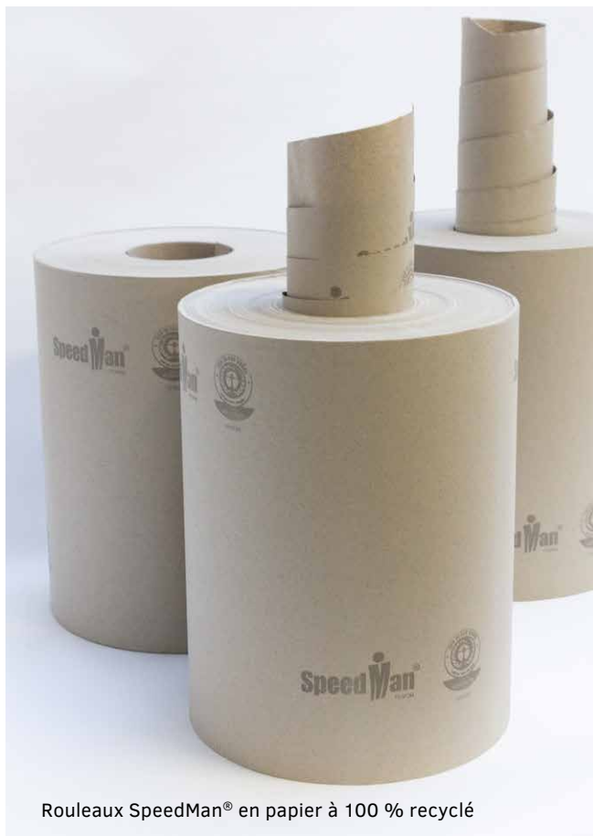
Rouleaux SpeedMan® en papier à 100 % recyclé