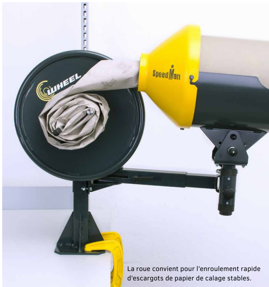
La roue convient pour l'enroulement rapide d'escargots de papier de calage stables.