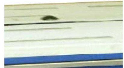
Table équipée de rouleaux de transport facilitant ainsi le positionnement des colis lourds et encombrants